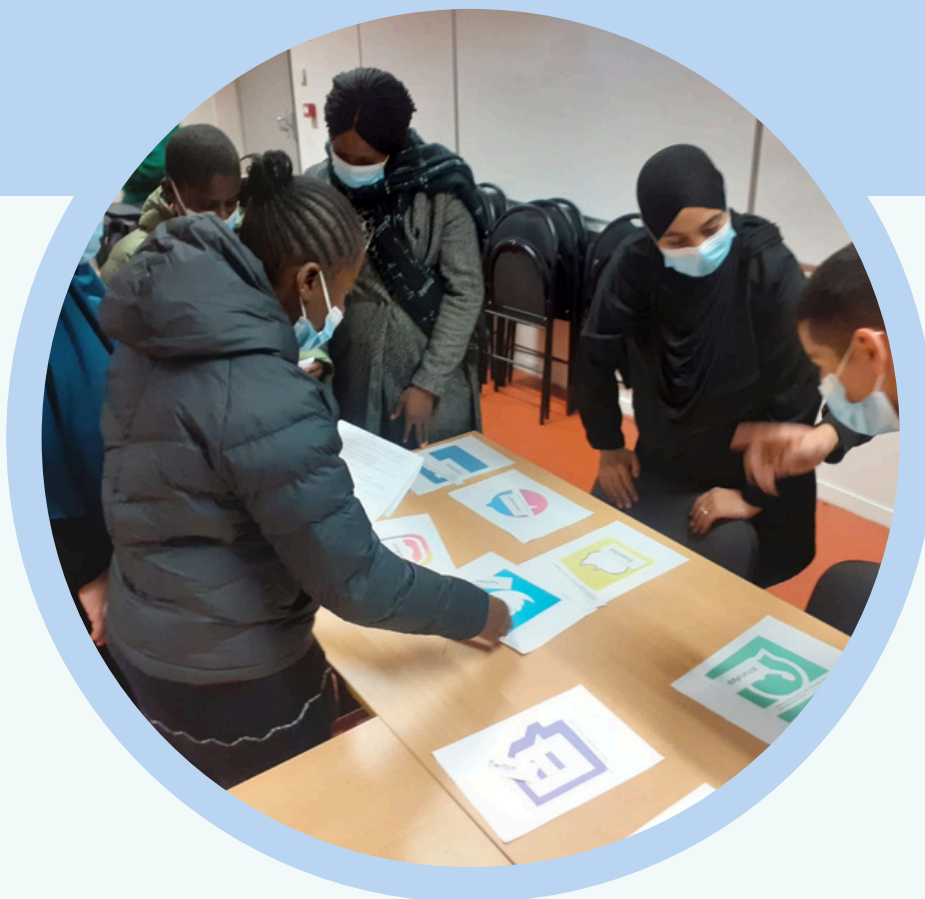
Atelier numérique parent-enfant, Orly, décembre 2021