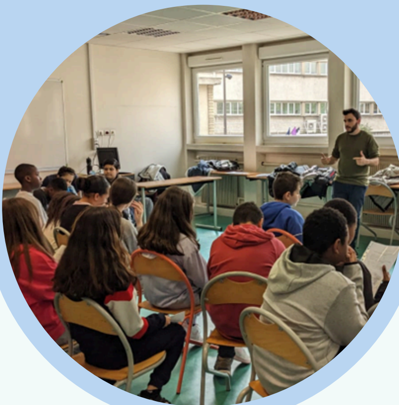
Théâtre forum sur les violences du quotidien, Collège Paul Langevin. Alfortville, mars 2023