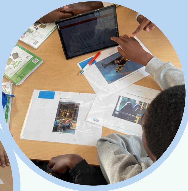
Semaine de la presse au collège Elsa Triolet. Champigny, Mars 2023