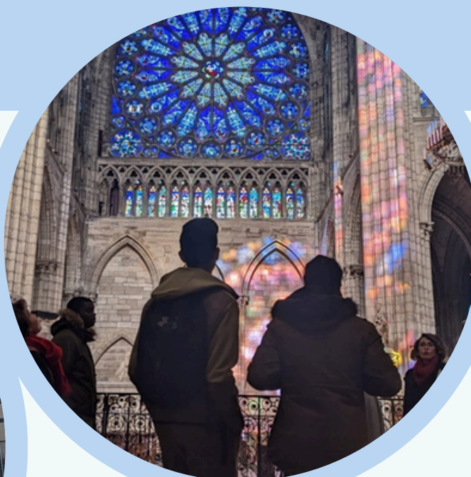
Parcours laïcité effectué avec une classe de remobilisation scolaire. Créteil 2022-2023