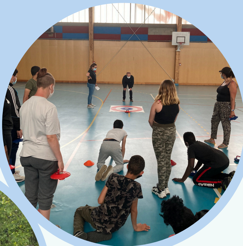
Journée départementale des Ateliers Relais, Créteil, juin 2022