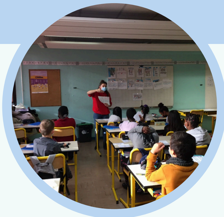
Intervention charte de la laïcité, Ecole Henri Wallon. Valenton, décembre 2022